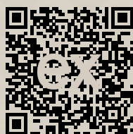
Link na ponuku