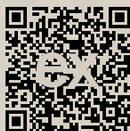
Link na ponuku