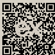
Link na ponuku