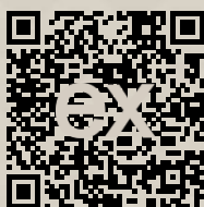
Link na ponuku