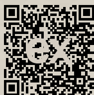
Link na ponuku