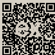
Link na ponuku