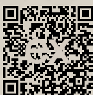
Link na ponuku