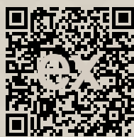
Link na ponuku