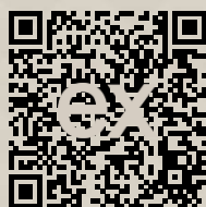
Link na ponuku