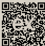
Link na ponuku