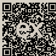
Link na ponuku