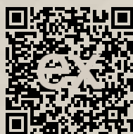
Link na ponuku