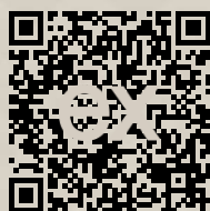
Link na ponuku