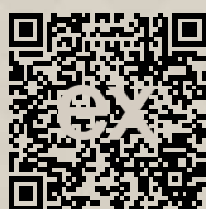
Link na ponuku