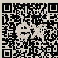
Link na ponuku