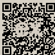
Link na ponuku