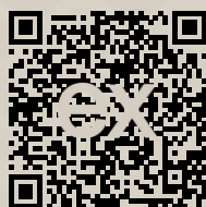
Link na ponuku