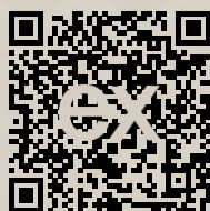
Link na ponuku