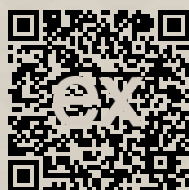
Link na ponuku