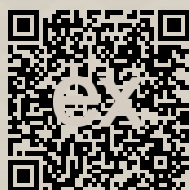
Link na ponuku